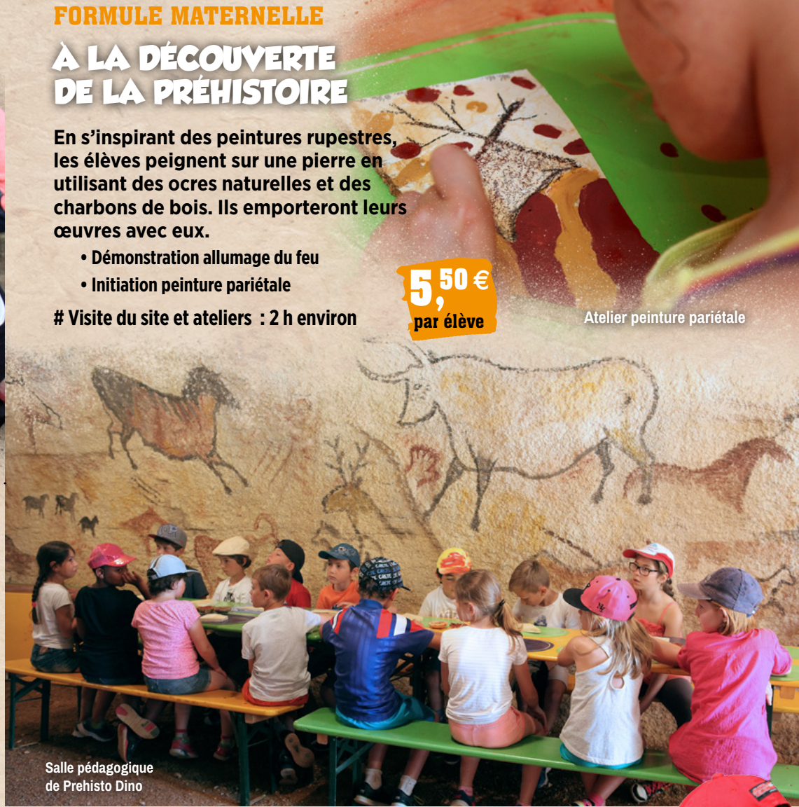
Salle pédagogique de Prehisto Dino

# Visite du site et ateliers : 2 h environ