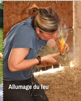
Allumage du feu