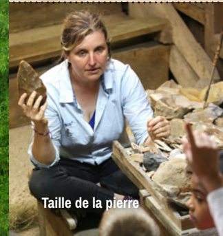
Taille de la pierre

# Visite libre du site : 1h environ # Durée des animations : 2 heures # Niveau : primaire